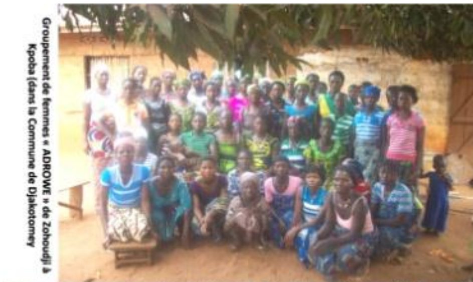
Groupement de femmes « ADROWE » de Zohoujli à Kpoba dans la Commune de Diakotomey