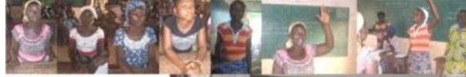
Groupement de femmes