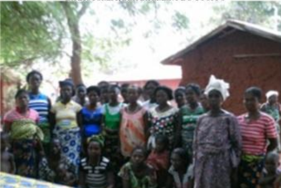
MEMBRES DU GROUPEMENT BIBIWE DE ONG APASIC DANS LE VILLAGE DE ASSOGBAHOUE , ARRONDISSEMENT DE SOKOUHOUE, COMMUNE DE DJAKOTOMEY, DEPARTEMENT DU COUFFO