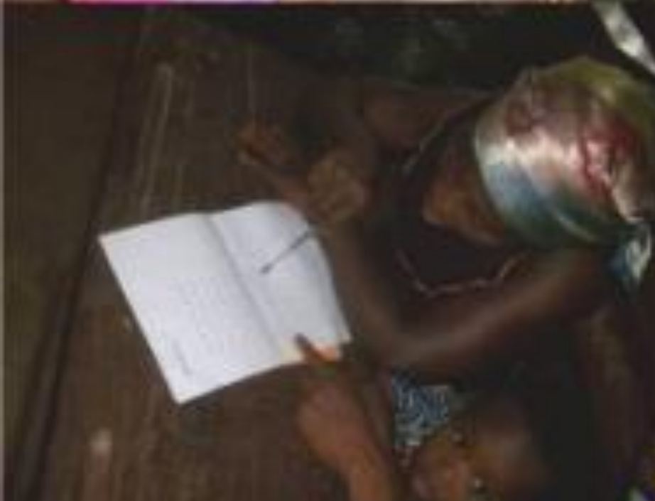
SEANCES D'ALPHABETISATION DES FEMMES, MEMBRES DES GROUPEMENTS DE L'ONG APASIC