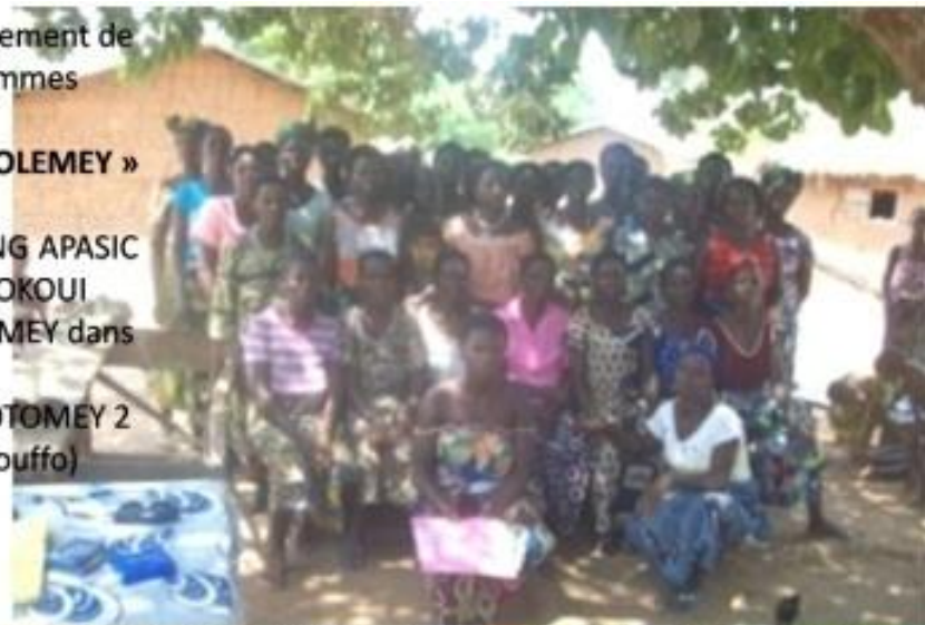
DJAKOTOMEY 2 (Couffo)