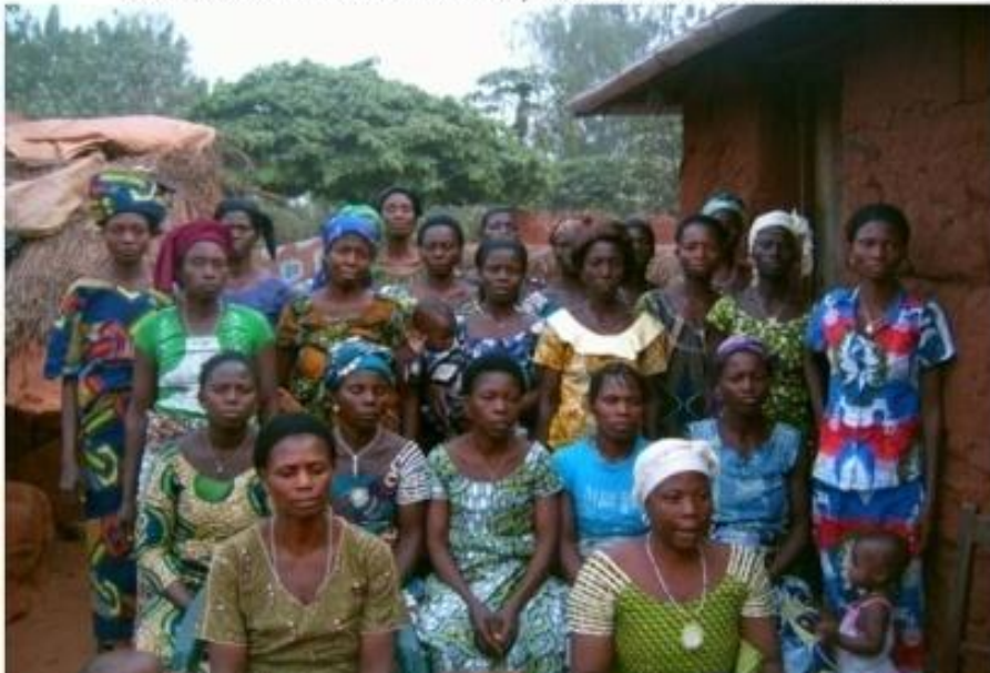
MEMBRES DU GROUPEMENT AYA-GOU DE ONG APASIC DANS LE VILLAGE DE SOKOUHOUE-CENTRE , ARRONDISSEMENT DE SOKOUHOUE, COMMUNE DE DJAKOTOMEY, DEPARTEMENT DU COUFFO