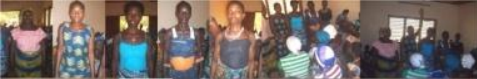
Groupement de femmes