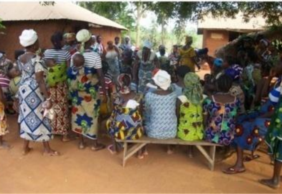
MEMBRES DU GROUPEMENT LONLONGNON DE ONG APASIC DANS LE VILLAGE DE TOKPOHOUE , ARRONDISSEMENT DE SOKOUHOUE, COMMUNE DE DJAKOTOMEY, DEPARTEMENT DU COUFFO