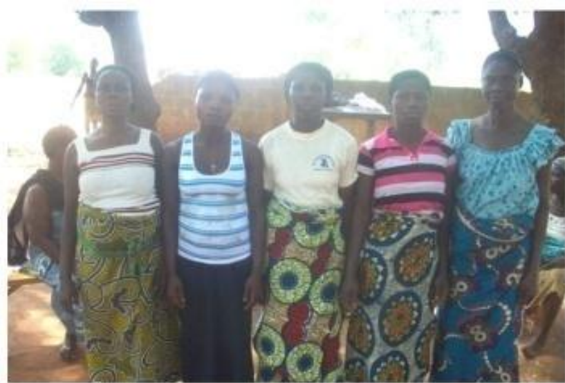
Groupement de femmes « NOULAGNON » de Kpoba Centre (dans la Commune de Djakotomey