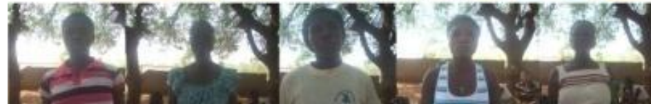
MEMBRES DU GROUPEMENT LONLONGNON DE ONG APASIC DANS LE VILLAGE DE SAHOU-AVODJIHOU , ARRONDISSEMENT DE SOKOUHOUÉ, COMMUNE DE DJAKOTOMEY, DEPARTEMENT DU COUFFO