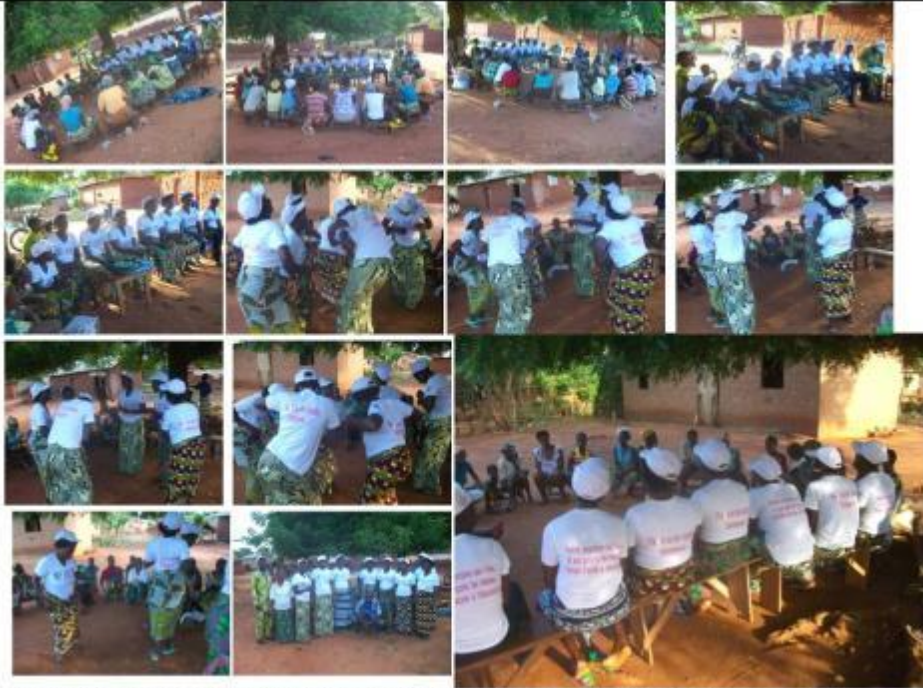
Distribution des teshirts et casquettes, don de Madame la Grande Chancelière de la République du Bénin : OSSEMI ANIORIN ROUBOURATHI