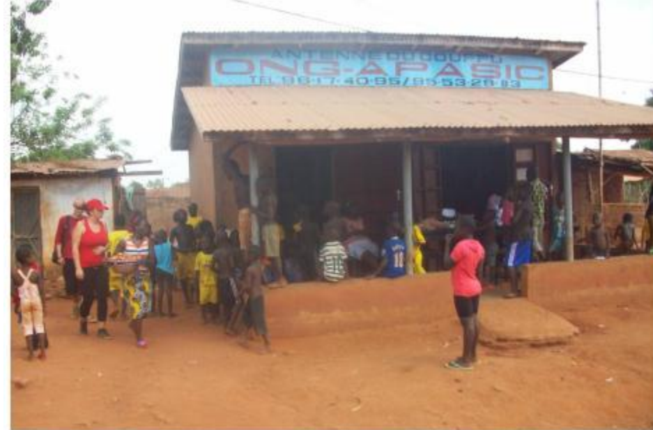
PRÉPARATION ET DISTRIBUTION DE DIVERS REPAS (EN PÉRIODE DE DISERTE ) PAR L'ONG APASIC AU PROFIT DES ENFANTS DE SOKOHOUE