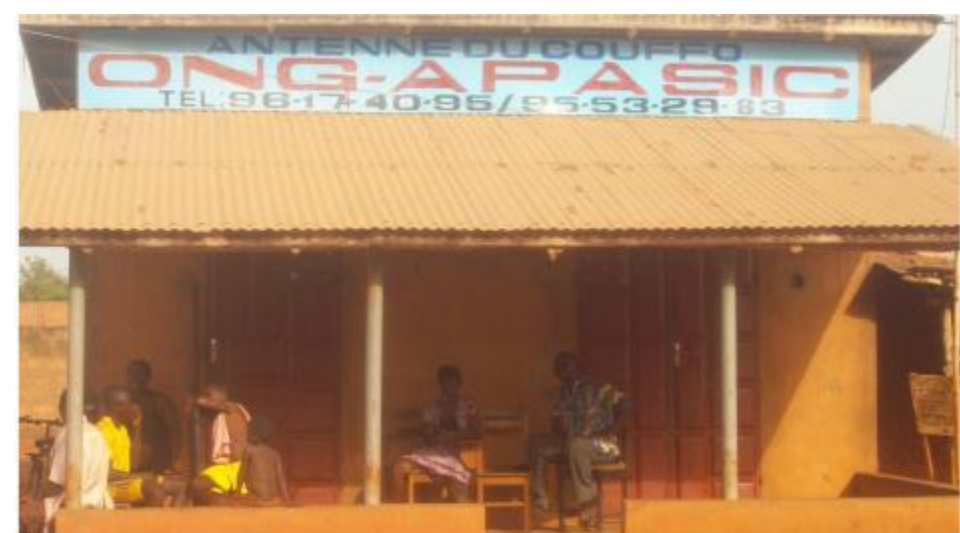
FETE DE DEPART DES STAGIAIRES BELGES (ARRIVÉS DU 24 NOVEMBRE 2012 AU 24 FÉVRIER 2013) AU SEIN DE L'ÉQUIPE DE L'ONG APASIC : ANIMÉE PAR LES GROUPEMENTS DE FEMMES DE L'ONG APASIC DE AVODJHOUÉ, HOUNKÉMEY ET TOKPOHOUE (LE 19 FÉVRIER 2013)