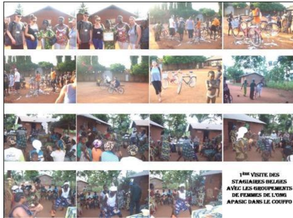
1 ère VISITE DES STAGIAIRES BELGES AVEC LES GROUPEMENTS DE FEMMES DE L'ONG APASIC DANS LE COUFFO