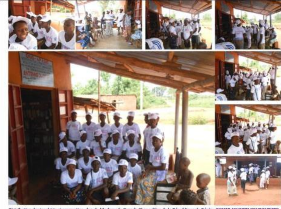
Distribution des teshirts et casquettes, don de Madame la Grande Chancelière de la République du Bénin : OSSEMI ANIORIN ROUBOURATHI