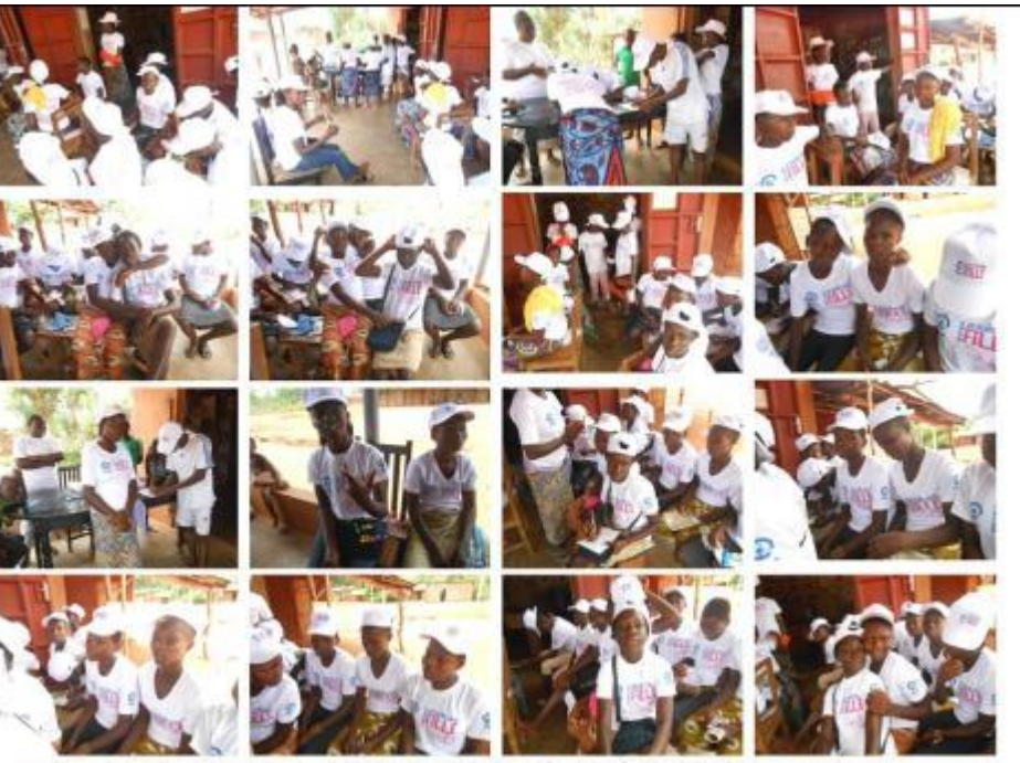
Distribution des teshirts et casquettes, don de Madame la Grande Chancelière de la République du Bénin : OSSEMI ANIORIN ROUBOURATHI