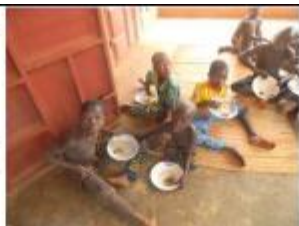
Noël aux enfants du village de Avodjihoué et environs (Arrondissement de Sokouhoué, Commune de Djakotomey, Département du Couffo au Bénin) et divers jeux organisés par les stagiaires Belges de l'ONG APASIC