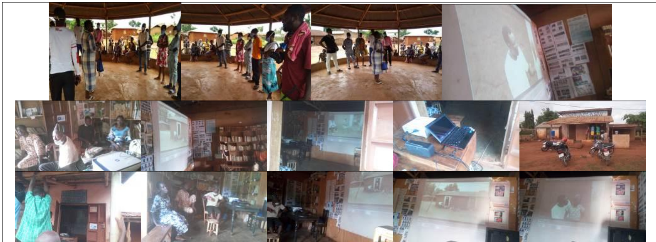
- Diffusion du téléfilm sketch durant huit (08) jours à la télévision Canal 3 Bénin et sur les réseaux sociaux.