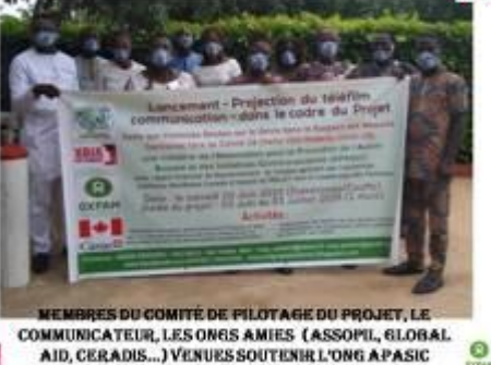
MEMBRES DU COMITE DE PILOTAGE DU PROJET, LE COMMUNICATEUR, LES ONGS AMIES (ASSOPI, GLOBAL AID, CERADIS...) VENUES SOUTENIR L'ONG APASIC