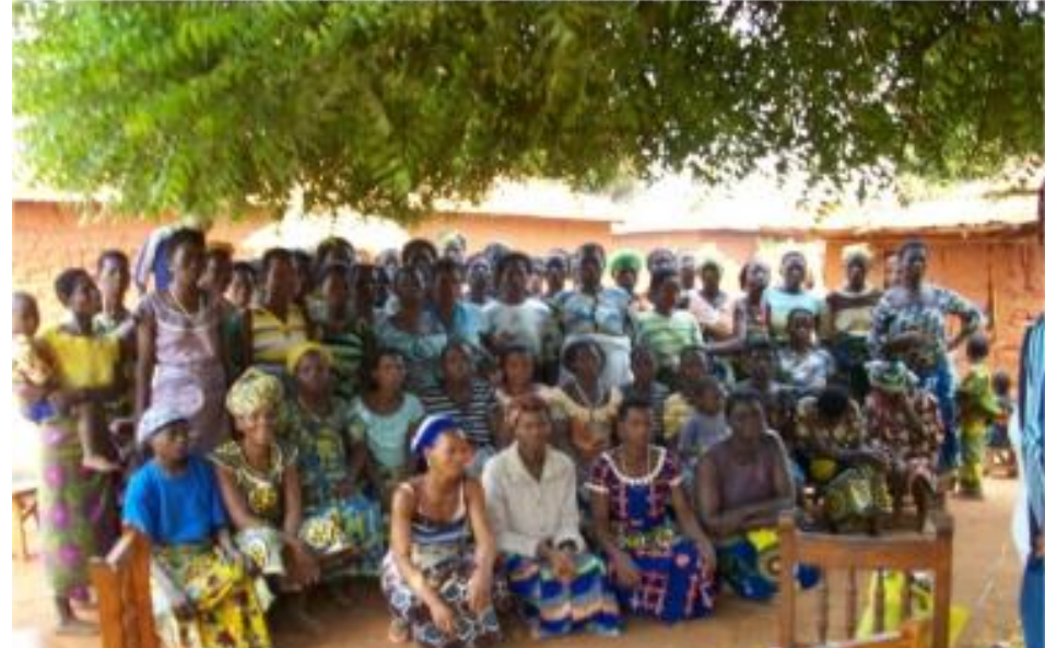
MEMBRES DU GROUPEMENT EMEFA DE ONG APASIC DANS LE VILLAGE DE ZOUZOUVOU, ARRONDISSEMENT DE SOKOUHOUE, COMMUNE DE DJAKOTOMEY, DEPARTEMENT DU COUFFO