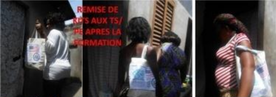
REMISE DE KIPS AUX TS/ ME APRES LA FORMATION