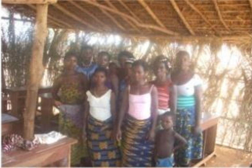
Groupement de femmes «ADROWE » de Nakidahohoué À Kpoba (dans la Commune de Djakotomey)