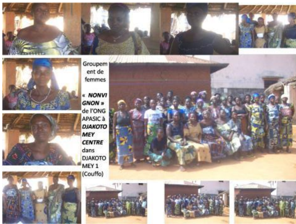
Groupement de femmes « NONVI GNON » de l'ONG APASIC à DJAKOTO MEY CENTRE dans DJAKOTO MEY 1 (Couffo)