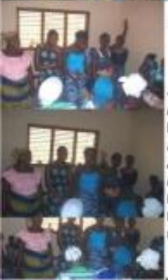
Groupement de femmes « GBENON DJOU » de l'ONG APASIC à AGBÉDRA NFO dans DIAKOTOMEY 1 (Couffo)