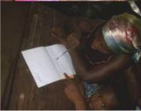
SEANCES D'ALPHABETISATION DES FEMMES, MEMBRES DES GROUPEMENTS DE L'ONG APASIG