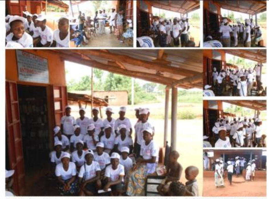
Distribution des teshirts et casquettes, don de Madame la Grande Chancelière de la République du Bénin : OSSEMI ANIORIN ROUBOURATHI