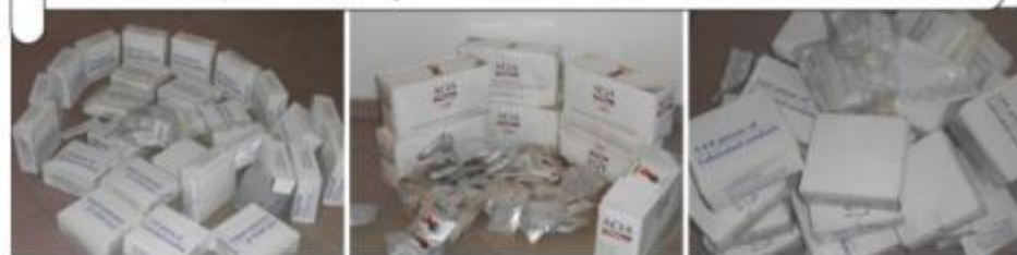
LES PRESERVATIFS POUR LES SEANCES DE SENSIBILISATION A JONQUET

LE 20 OCTOBRE 2013 A JONQUET DANS LA MAISON DE SISSI • L'UN DES 11 SITES