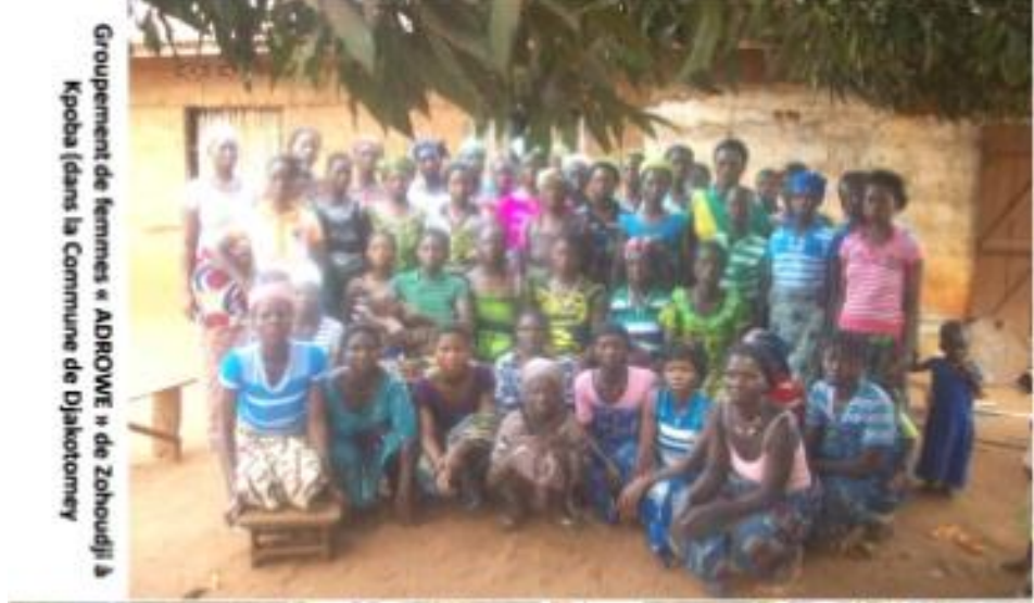
Groupement de femmes « ADROWE » de Zohoujli à Kpoba dans la Commune de Diakotomey