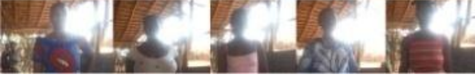
Groupement de femmes