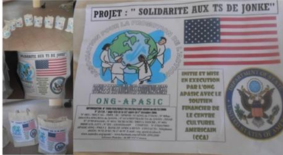
11 KITS AUX 11 TS / P.E