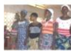
Groupement de femmes « MIAN ONDJOU » de l'ONG APASIC à BEOTCHI dans DIAKOTOMEY 1 (Couffo)